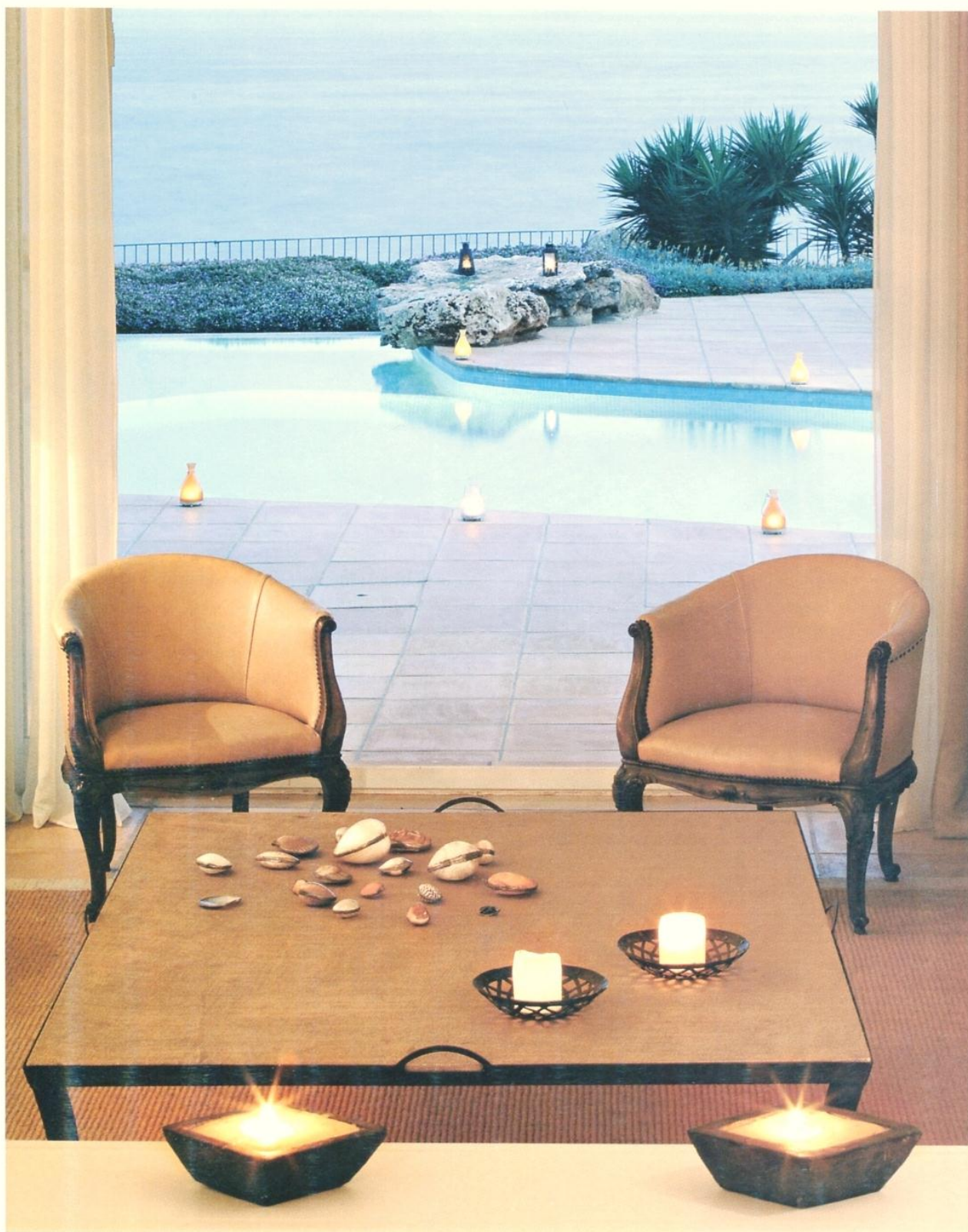
SOPRA. ATMOSFERE SOFFUSE IN UN ANGOLO DEL SOGGIORNO CON VISTA SULLA PISCINA. LA PAVIMENTAZIONE ESTERNA DELLA VILLA, COSTRUITA NEI PRIMI ANNI SETTANTA, E' IN COTTO.